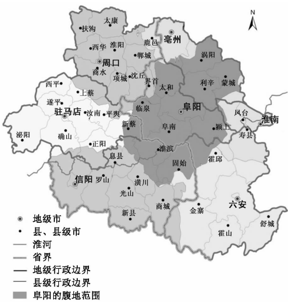
图3 豫皖省际边界地区各市腹地范围

依据得到的场强数据,利用 GIS 中的空间叠置分析方法对各市的腹地进行划分(图3)。从图中可以看出,阜阳市在研究区域内的影响范围比较广泛,其腹地面积为 20 581 km 2 ,远远超过了其行政管辖面积(9 775 km 2 )。阜阳的腹地范围所覆盖的其他市的县主要有:亳州的涡阳、蒙城、利辛;六安的霍邱;信阳的固始、淮滨、息县、潢川;驻马店的新蔡。