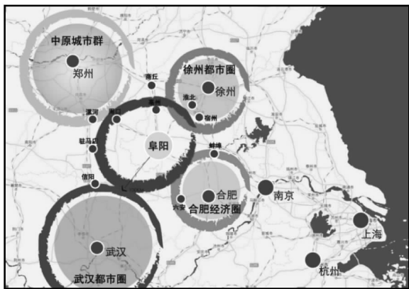
图1 阜阳市在周边都市圈中的位置

从区域发展战略与政策来看,阜阳及周边地区位于中原城市群、合肥经济圈、武汉都市圈及徐州都市圈等战略规划所涉及的范围之外(图1),在整个中部崛起中属于“塌陷区”。阜阳市被周围各个城市群、经济圈孤立起来了,可城市并不是一个绝对独立发展的单元,而是处于一定的区域经济背景之下的相对独立单元 [8] ,对一个城市的孤立将严重影响区域的协调发展。